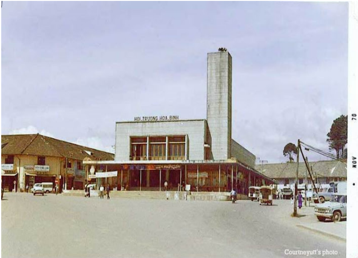
Hoa Binh "convention center," see how quiet and empty the streets are in 1970