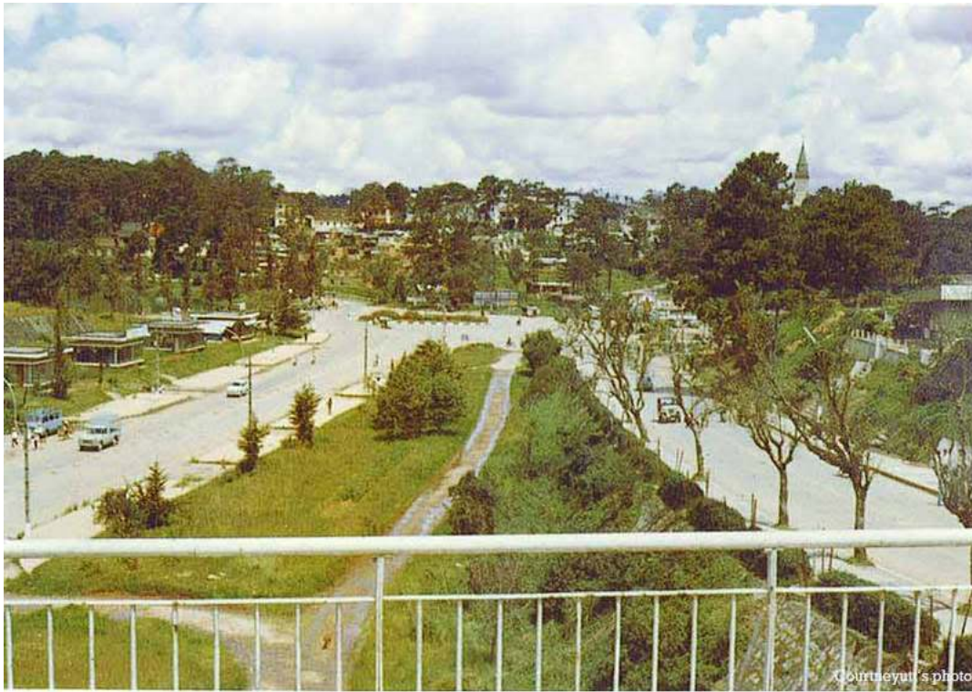
Looking toward "Ông Đạo" bridge, from hotel "Mang Đen"