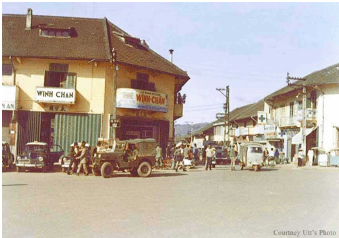
“Vinh Chan” boulangerie on the left of top end of Duy Tan street (seen from Hoi Truong Hoa Binh)

“Đ n năm 54, nh ng ti m ph B c n i lên v i Ph B ng đ ng Hàm Nghi, Ph Tín bên hông ch và cà phê Tùng v i cà phê Ban Mê Thu t và nh c trào l u m i quy n trong khói thu c lá m t mù. Vài năm sau có gia đình l u l c t Nam Vang lên đây m ti m h ti u Nam Vang l ng danh. G n r p chi u bóng Ng c Hi p, đ u h m t Phan Đình Phùng đi qua đ ng Hai Bà Tr ng là quán Mì Qu ng v i h ng v đ c bi t n i danh l i do m t ông ng i B c vào Nam t nh ng năm 1940 đ ng n u. Ngay góc đ ng đ u d c Duy Tân có ti m làm bánh mì Vĩnh Ch n nóng giòn t sáng s m cho đ n khuya” ... “V khuya, khi các ti m t p hóa đóng c a, quanh khu ch Hoà Bình và đ ng nh trở c m t khách s n Th y Tiên đã m ra các gánh b p n ng, cháo gà, bún riêu, bún bò... cho khách đi ch i v đêm.”